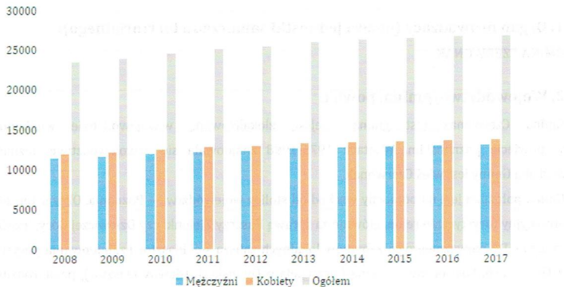
Wykres 1. Liczba ludności w Gminie Czerwonak wg faktycznego miejsca zamieszkania w latach 2008-2017

Na tej podstawie można więc przypuszczać, że w kolejnych latach liczba mieszkańców Gminy Czerwonak również będzie stopniowo wzrastać.